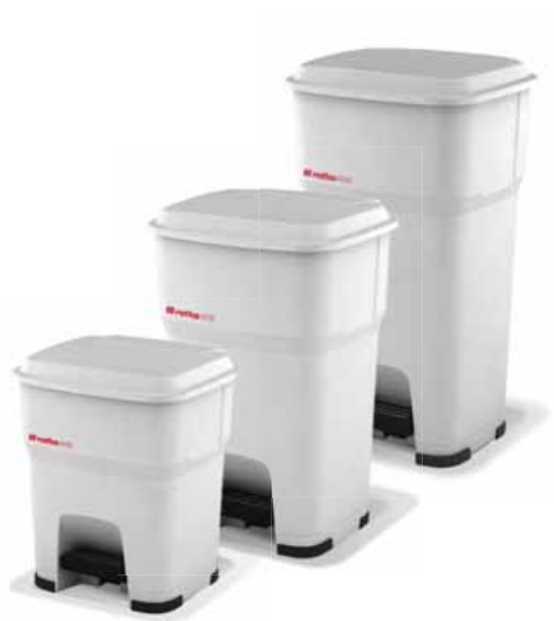
35L Modell | 5200 60L Modell | 5230 85L Modell | 5260